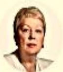
РУКОВОДИТЕЛЬ О. Ю. ВАСИЛЬЕВА Министр просвещения РФ