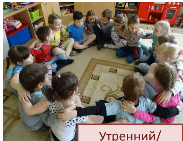
Утренний/ вечерний круг