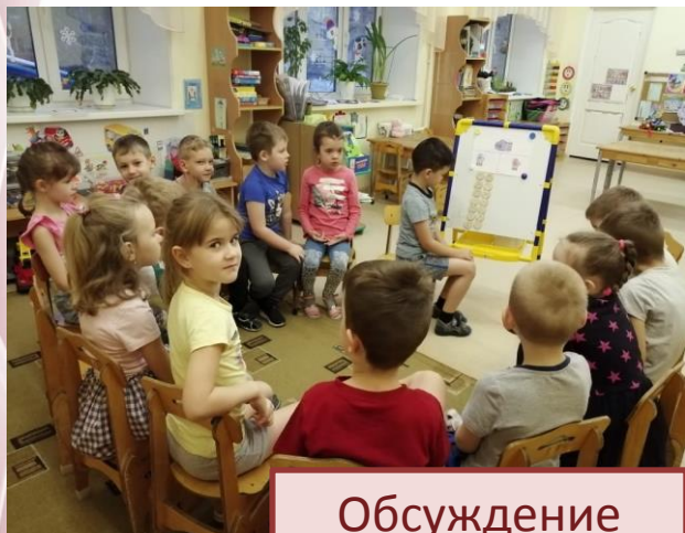
Обсуждение загадки дня