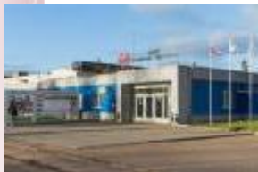
Предприятия и учебные заведения