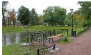
Парки и усадьбы