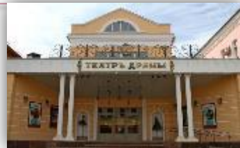
Театры и концертные залы