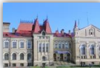
Музеи и выставки