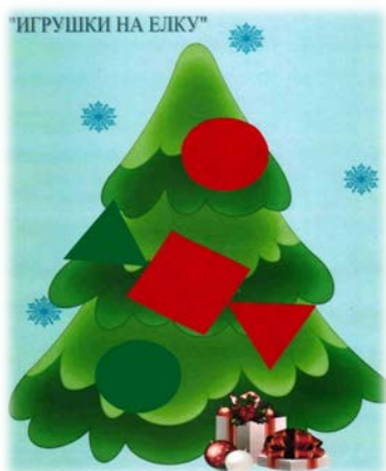
Рис. 2. Украшаем елочку

Одним из наиболее востребованных пособий для плоскостного конструирования является «Фонарики» РИВ. Чтобы работа с играми, особенно на начальном этапе, была более интересной и эффективной, нами разработаны цветные схемы, например, «Конфета на тарелке», «Украшаем елочку».