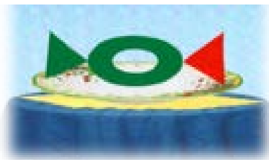
Рис. 1. Конфета на тарелочке

Из сказочных персонажей для мотивации к деятельности, активизации речевого общения нам помогают «Медвежонок Мишик», «Гусь Капитан Океанкин», «Галчонок Карчик», «Пчелка Жужа», персонажи на панно «Фиолетовый лес» (РИВ), ростовые куклы, мягкие игрушки.