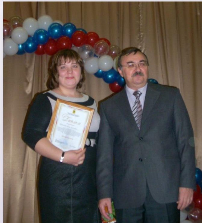
«Мастер года – 2012»