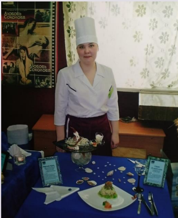
Областной конкурс профессионального мастерства среди мастеров производственного обучения по профессии «Повар» - 2007 г.